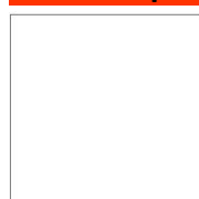
Blanc (ral 9010)