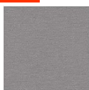
Aluminium (ral 9006)